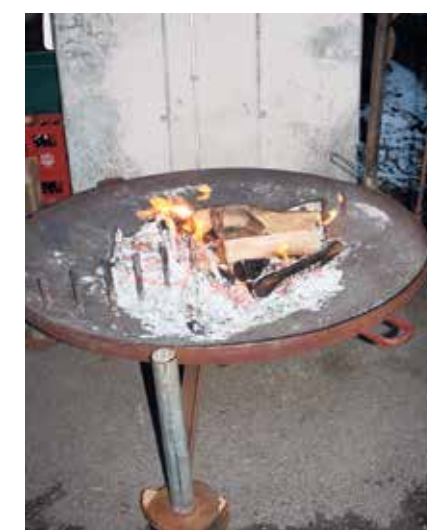
Feurig: In der Schale spendet Holz Wärme und Gemütlichkeit.

Tankstelle, oder lose in «BigBag» abgefüllt, für Kunden, die einen Kubikmeter optimal lagern können. Pellets werden lose aus dem Tankwagen ver-