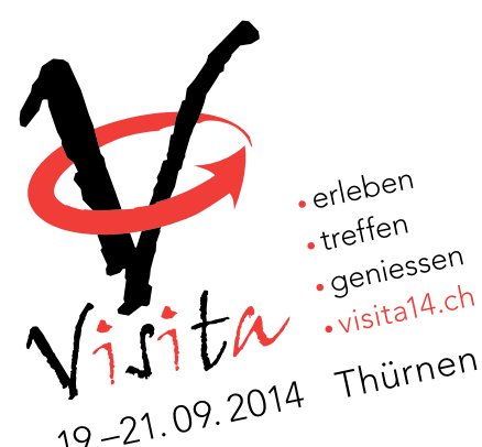
So präsentiert sich das Logo zur kommenden Gewerbeausstellung.