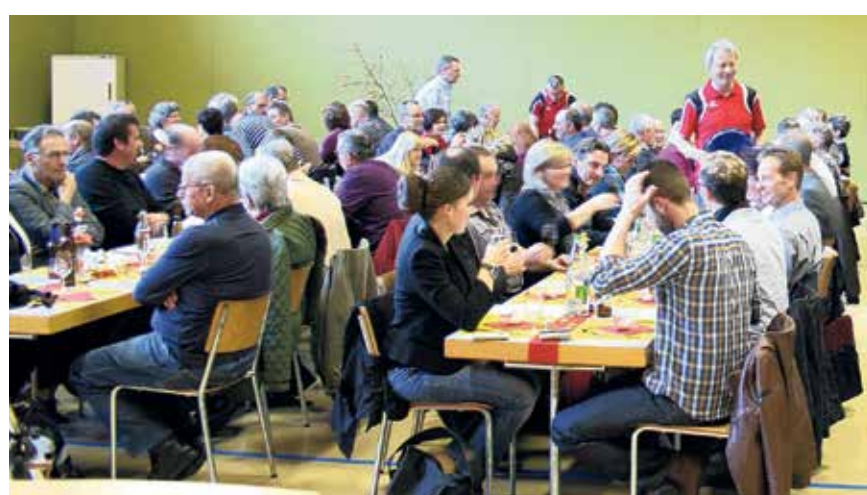
Mit Elan und Freude bei der Sache: Vereinsmitglieder bei der jährlichen Versammlung.

Über hundert Personen folgten der Einladung zur 47. Jahresversammlung des Gewerbevereins KMU Homburger-/Diegtal und Umgebung nach Läuelfingen. Dort erfuhr man Neues zur Gewerbeausstellung in Thümen.